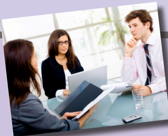
№ 1. Устаревшее резюме.

Давайте рассмотрим наиболее типичные ошибки, которые, к сожалению, допускают многие молодые соискатели.