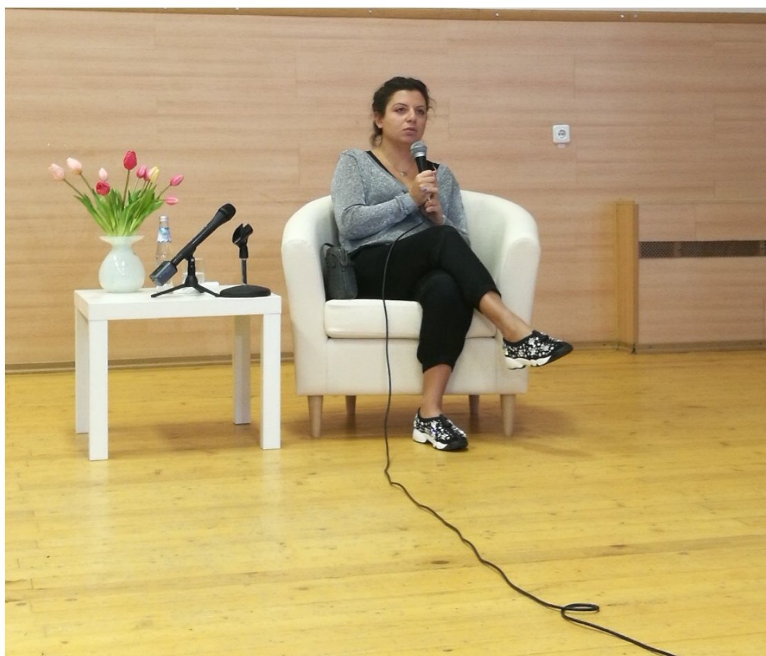
лекция от Маргариты Симоньян, главного редактора RT

Посещать регулярно организуемые лекции от известных политологов, дипломатов, специалистов в сфере МО