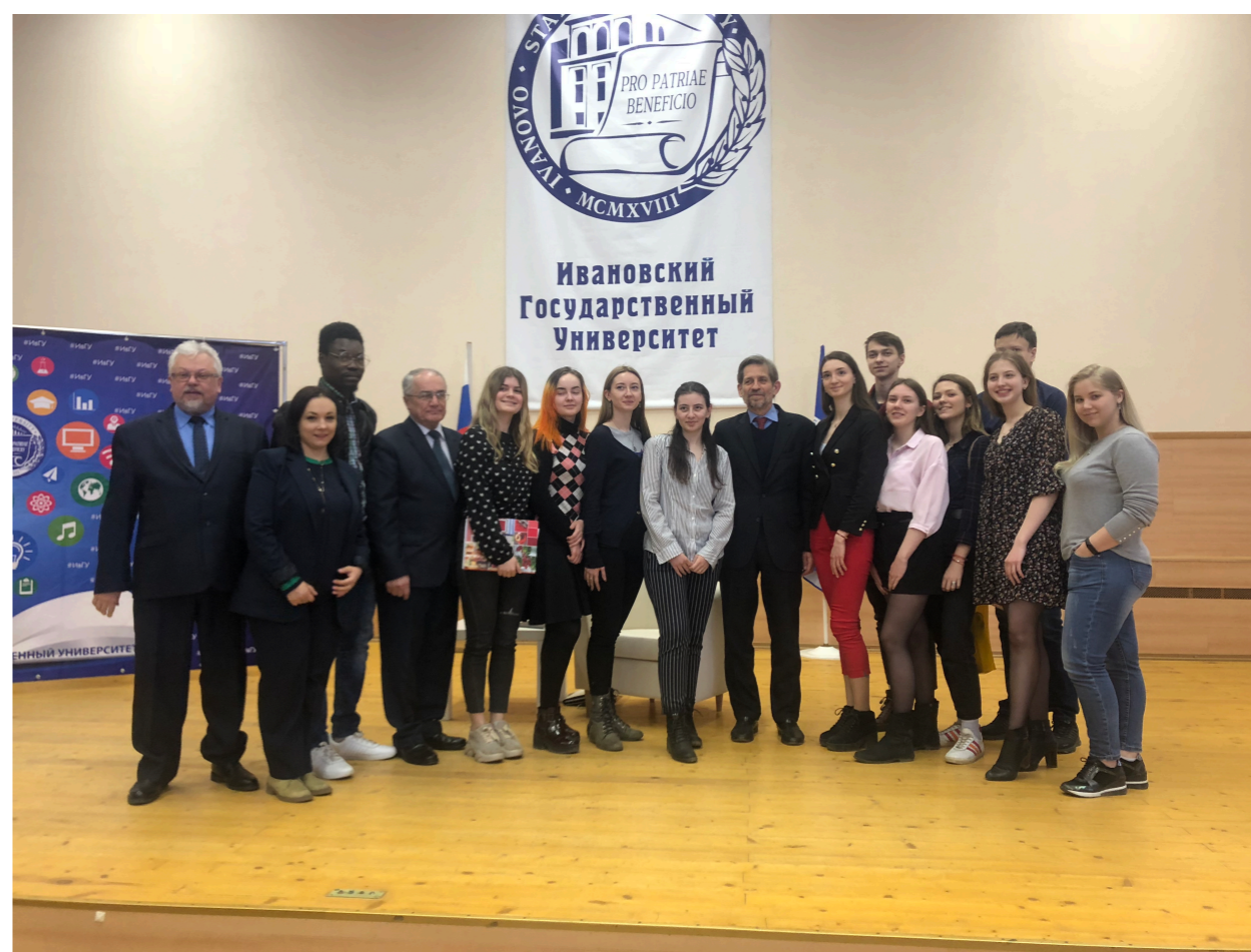
встреча с Томасом Грэмом, американским политологом, бывшим советником Дж. Буша по России